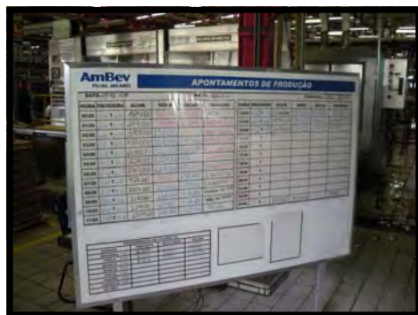
Les tableaux que nous retrouvons dans n'importe quelle brasserie d'In-bev